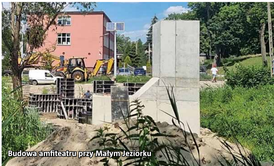
Budowa amfiteatru przy Małym Jeziorku

chodnika i ścieżki rowerowej z Nowego Dworu w kierunku Wielkiego Łęcka o łącznej długości ok. 1850 m.