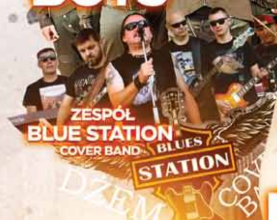
ZESPÓŁ BLUE STATION COVER BAND