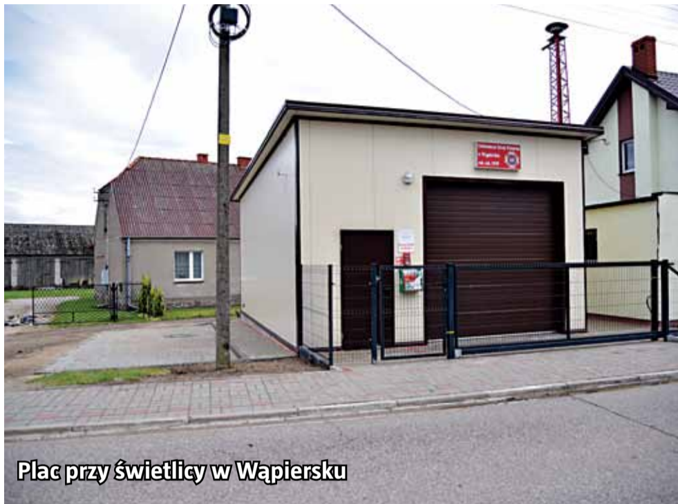
Plac przy świetlicy w Wąpiersku