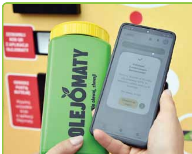
PIERWSZY OLEJOMAT W WOJEWÓDZTWIE