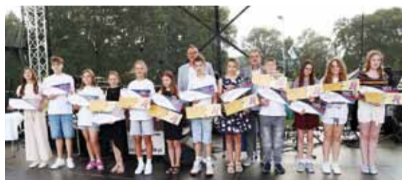
Dni Lidzbarka 2025

Tegoroczne lato w Lidzbarku upłynęło pod znakiem muzyki, wspólnej zabawy i lokalnych smaków.