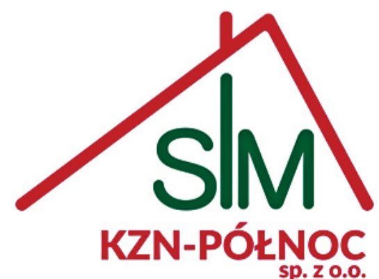
SPOŁECZNA INICJATYWA MIESZKANIOWA