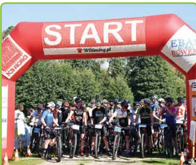
WELTRACK MTB MARATON