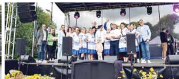
Festiwal Swojskich Potraw Rybnych

W dniach 25–27 lipca odbyły się Dni Lidzbarka 2025, które jak co roku przyciągnęły tłumy mieszkańców i gości. W programie znalazły się koncerty, turnieje sportowe, atrakcje plenerowe oraz wręczenie nagród