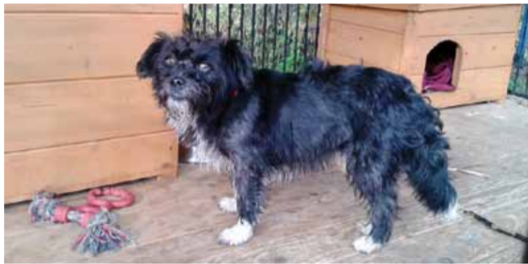
Pierwszy pies w lidzbarskim kojcu

Tam, gdzie inni widzieli ograniczenia, ja dostrzegałam możliwości. Jako wolontariuszka i pełnomocnik fundacji AFN w Ostródzie podjęłam działania, które doprowadziły do powstania gminnej przechowalni dla zwierząt, nazwanej przytuliskiem. Dzięki dobrej współpracy z władzami miasta, urzędnikami, służbami mundurowymi i lekarzami weterynarii udało się opracować procedury